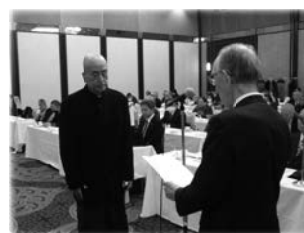
表彰を受ける飲食組合代表