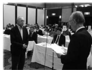
表彰を受ける熱田地区代表