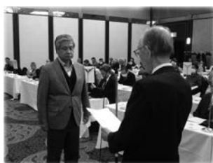
表彰を受ける酒販組合代表