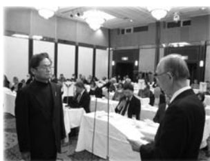
表彰を受ける中華組合代表