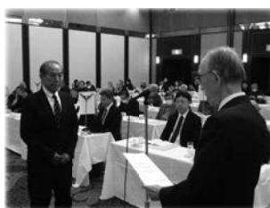
表彰を受ける麺類組合代表