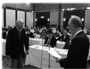
表彰を受ける瑞穂地区代表