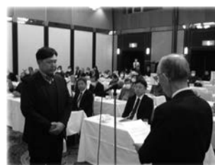
表彰を受ける千種地区代表