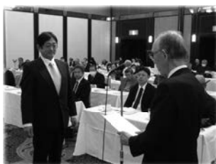
表彰を受ける名東地区代表