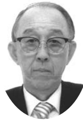
公益社団法人名古屋市食品衛生協会会長 名古屋市食品国民健康保険組合理事長