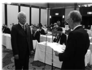
表彰を受ける緑地区代表