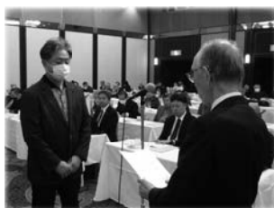
表彰を受ける天白地区代表