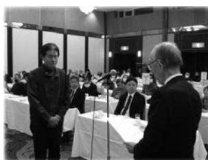
表彰を受ける西地区代表

被表彰組合は、令和六年度の一年間、毎月二十五日までに、保険料を全額徴収納付された組合です。本当にご苦労さまでした。