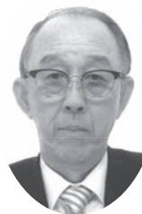
公益社団法人名古屋市食品衛生協会会長 名古屋市食品国民健康保険組合理事長