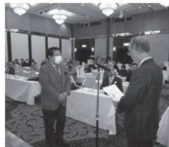
表彰を受ける熱田地区代表