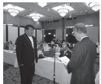
表彰を受ける社交組合代表