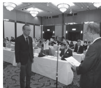
表彰を受ける旅館組合代表