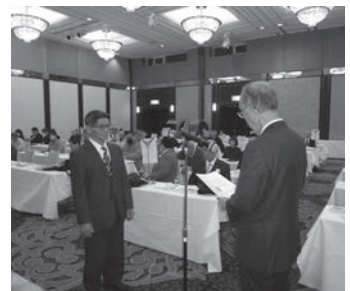
表彰を受ける中川地区代表