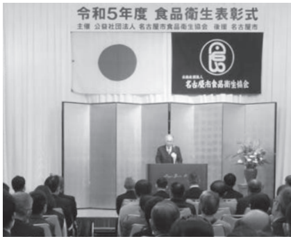
令和5年度 食品衛生表彰式