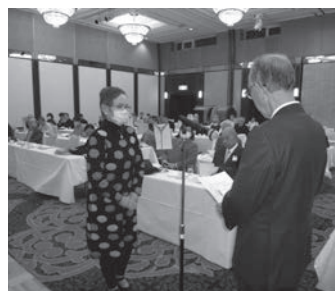
表彰を受ける喫茶組合代表