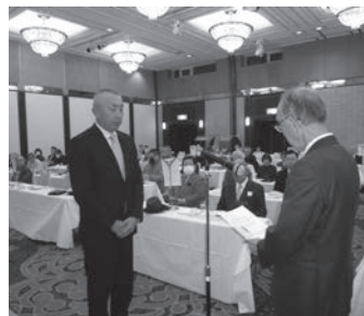
表彰を受ける昭和地区代表