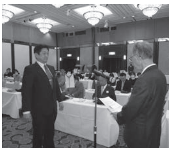
表彰を受ける名東地区代表