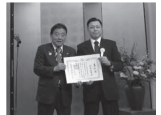
主催 公益社団法人 名古屋市食品衛生協会 後援 名古屋市