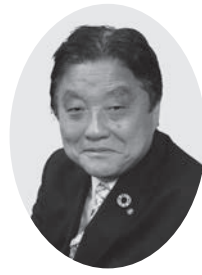
名古屋市長 河村 たかし

あけましておめでと うございます。年頭に あたり、謹んでご挨拶 を申し上げます。