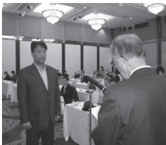
表彰を受ける千種地区代表

被表彰組合は、全組合の九五・三％（前年度九四・八％）です。未達成組合は四・七％（同五・五％）の一五組合（同一七組合）でした。前年度より達成組合は多くなりました。未達成組合にありましては、被表彰組合を目指して努められるようお願いいたします。被表彰組合は、令和四年度の一年間、毎月二十五日まで、保険料を全額徴収納付された組合です。本当にご苦労さまでした。