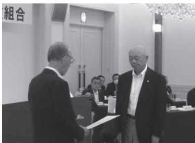
地区表彰を受けられる 市外代表（すし商組合）