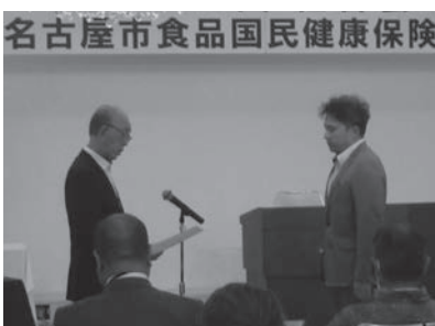
地区表彰を受けられる 市内代表（東地区）