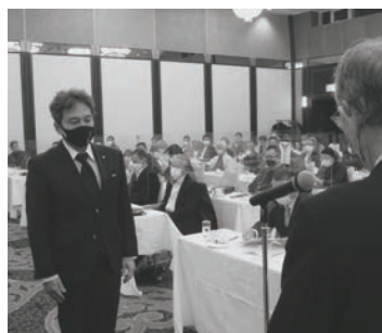
表彰を受ける東地区代表