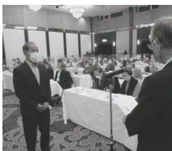
表彰を受ける麺類組合代表