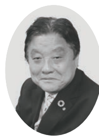
名古屋市長 河村 たかし

あけましておめでとうございます。年頭にあたり、謹んでご挨拶を申し上げます。 約3年にも及ぶコロナ禍で、新たな行動制限を伴うことなく社会経済活動を維持するため、市民・事業者の皆様には基本的な感染防止対策の徹底などにご協力いただくとともに、医療従