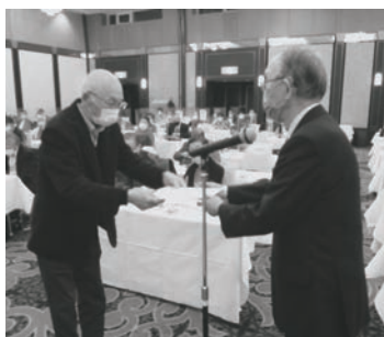
表彰を受ける瑞穂地区代表