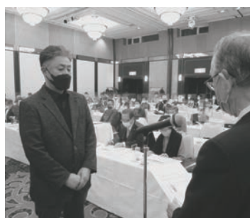
表彰を受ける天白地区代表