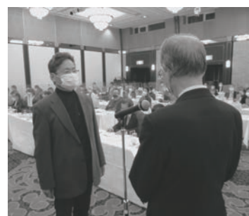
表彰を受ける中華組合代表