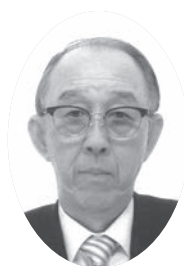
公益社団法人名古屋市食品衛生協会会長 名古屋市食品国民健康保険組合理事長