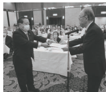
表彰を受ける守山地区代表

被表彰組合は、令和三年度の一年間、毎月二十五日までに、保険料を全額徴収納付された組合です。本当にご苦労さまでした。